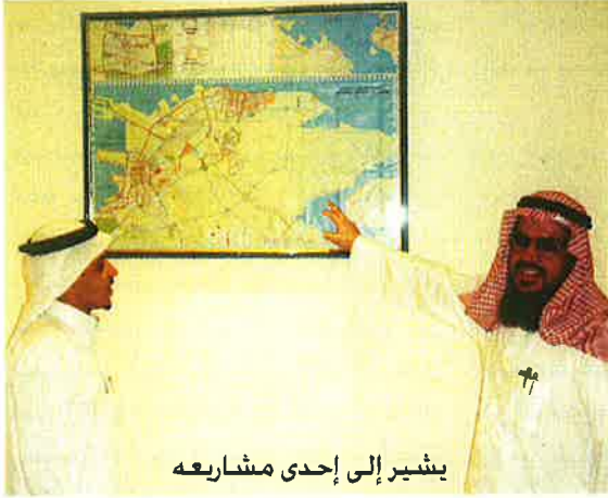
يشير إلى إحدى مشاريعه

"أولى مشاريعي بسطة على الأرض وبعد التطوير عربية متقلبة على أربع عجلات"