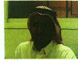
هشام بن عبدالعزيز