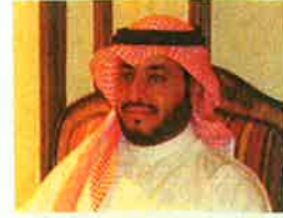
فهد بن عبد الله