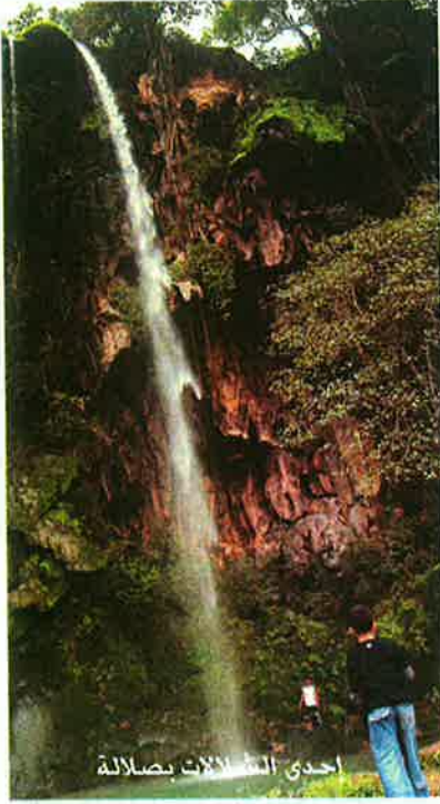
احدى الشلالات بصلالة

قمة في الروعة جمع بين جمال الطبيعة وبساطتها وبرودة الجو ولطفة، وأنت على الشاطيء تداعب وجهك نسيمات باردة محملة برذاذ بنعش، وحرارة الجو لاتزيد عن ٢٨ درجة مئوية بعد الظهر على الساحل ولا تكاد تحس برطوبة ..الغريب في هذه