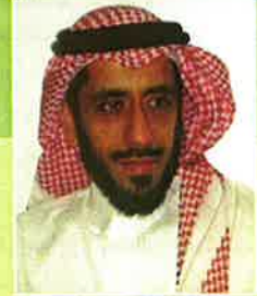
بقلم: أبو ريان بندي بن عبد الرحمن

ثانياً - ترشيد التعرض لهذه القناة حتى وإن كان محتواها مأموناً، بسبب الأضرار التي تسببها المشاهدة السلبية لفترات طويلة. وقد تكلم المتخصصون في هذا الأمر كثيراً. إضافة إلى أن تحديد فترات المشاهدة بصورة حازمة يعوّد الطفل على الانضباط والإحساس بقيمة الوقت. ثالثاً - متابعة ما يعرض على هذه القناة والتفاعل مع الطفل أثناء مشاهدته لها، ومن الممكن الاستفادة من هذه الفرصة لتوجيه انتباهه لأمر إيجابي أو صرفه عن أمر سلبي عارض. خاصة أنه مهما كان المحتوى سليماً بالجملة فإنه قد لا يخلو من ثغرات خطيرة.. مثل ظهور مشهد عنف أو رعب غفلت عنه أيدي الرقابة. هذا الكلام ينطبق أيضاً على الألعاب الإلكترونية، التي باتت سوقاً ضخمة تتنافس فيها الشركات العالمية لتزويد من حجم استثماراتها وحصتها من السوق. ولو كان ذلك على حساب تلك الشريحة البريئة الواعدة التي نتحمل نحن مسئولية رعايتها وتربيتها. نعوذ بالله تعالى أن نكون من يخربون بيوتهم بأيديهم.