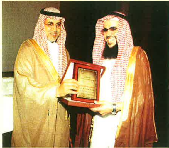
نائب وزير التربية بكرم العم أبو عبد الرحمن

ومنها صفة (العلم والثقافة) فهو من القلائل من رجال الأعمال من جيله الذي يحمل الدرجة الجامعية (البكالوريوس) في علوم اللغة العربية من كلية اللغة العربية من جامعة الإمام محمد بن سعود الإسلامية .. فكثير من رجال