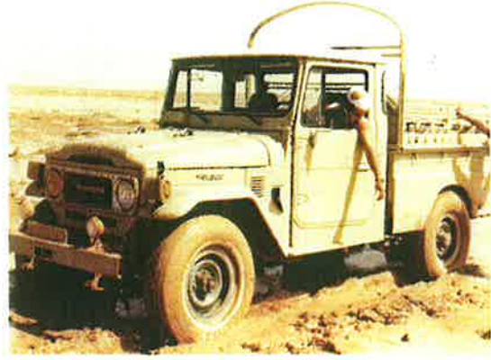
من الحماس غطت الطاقة